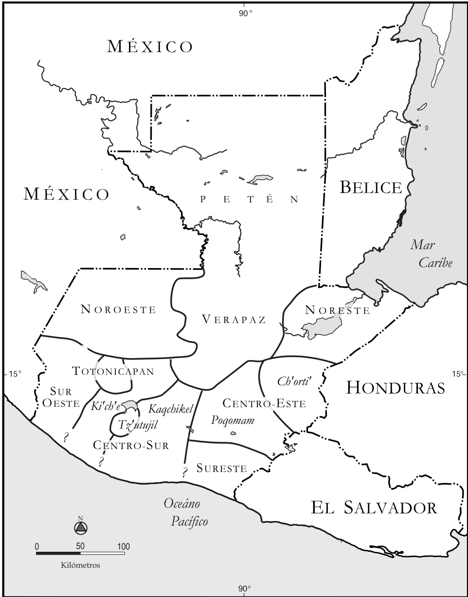
Figura 2. Regiones demográficas de Guatemala.