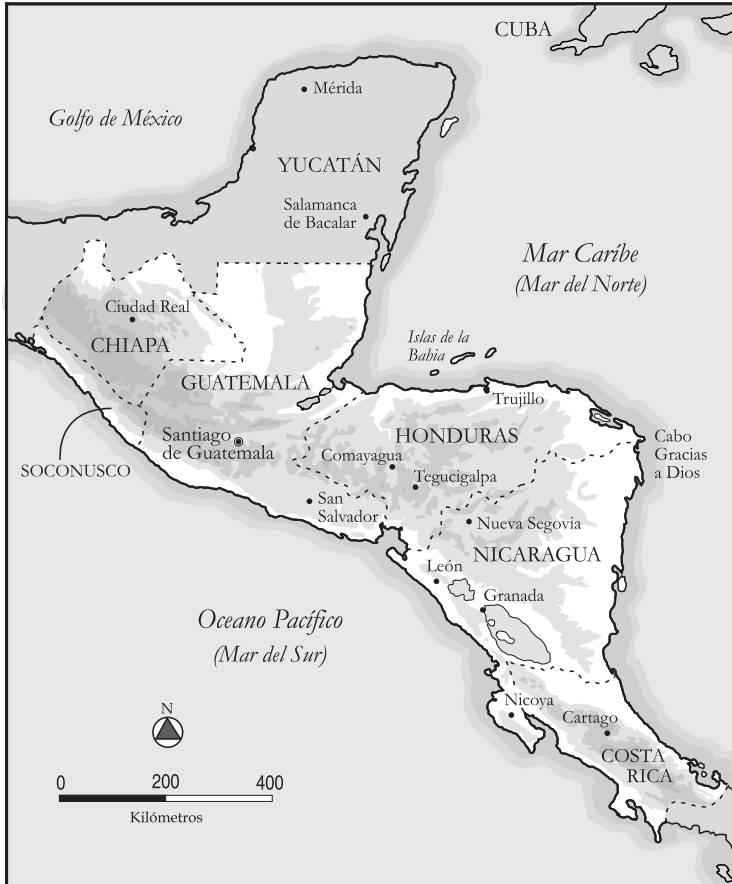
Figura 1. Términos geográficos de la Audiencia de Guatemala.

del mestizaje, apenas considerado por Cook y Borah, pero que recibe una atención cada vez mayor en los actuales estudios sobre la Centroamérica española. Finalmente, examinamos la distribución de la población y de los grupos étnicos en vísperas de la Independencia.