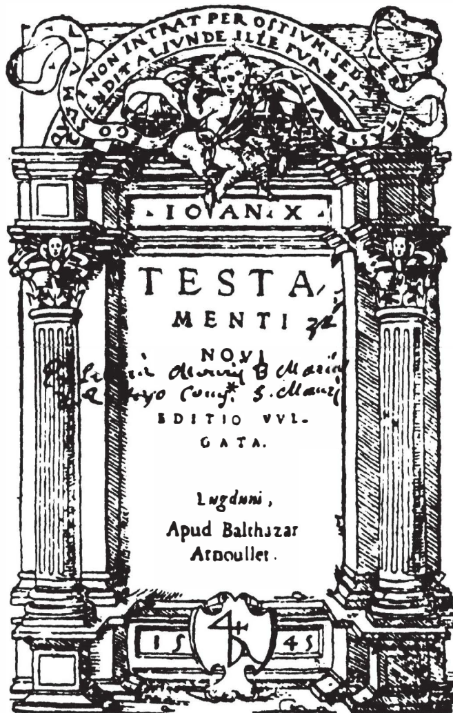
Frontispice avec les initiales B. A.

— TESTA- || MENTI || NOVI || * || EDITIO VVL- || GATA, || Lugduni , || Apud Balthazar || Arnoullet. || [Dans le bas de l'encadrement :] 1545.